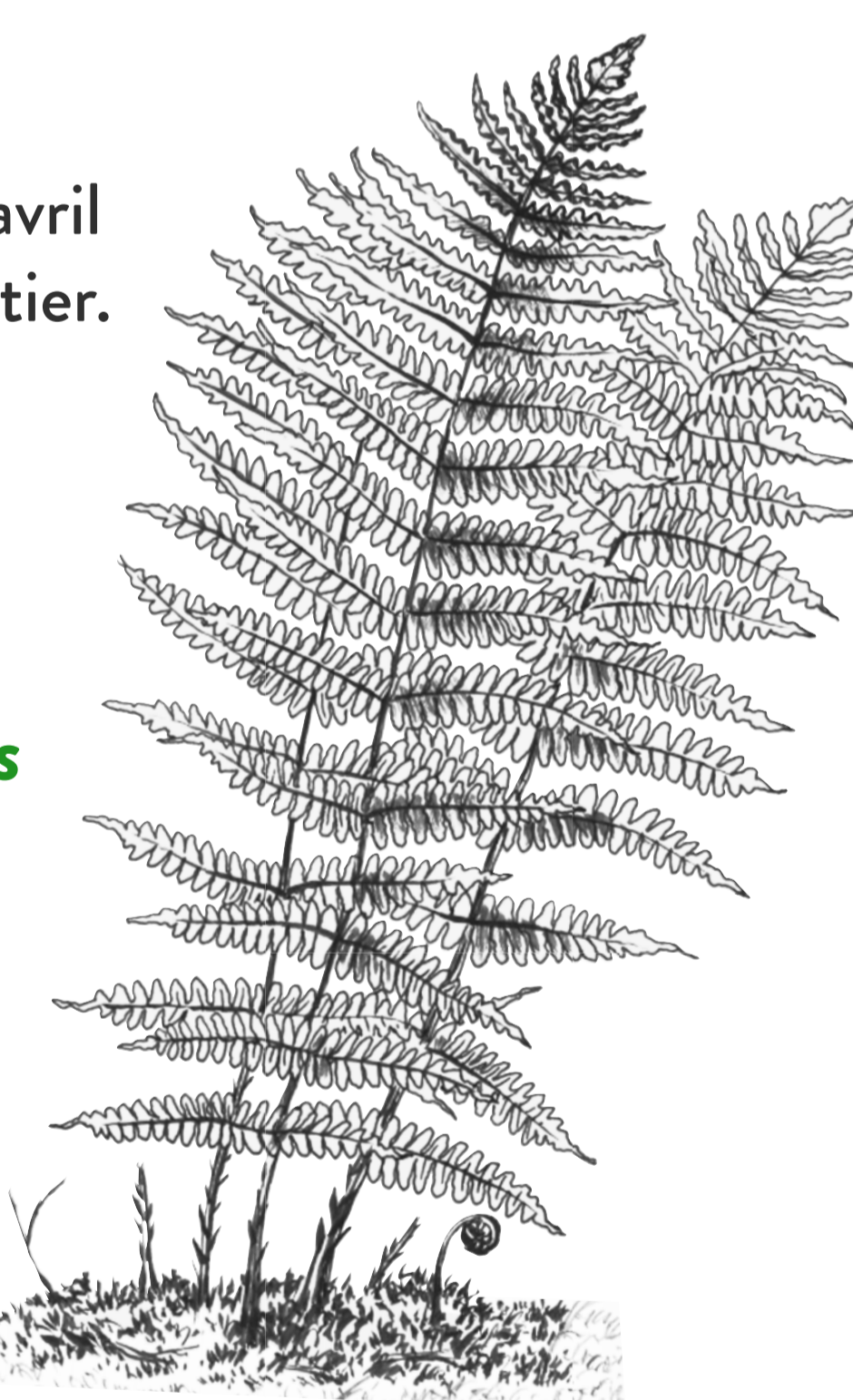
Fougère des marais