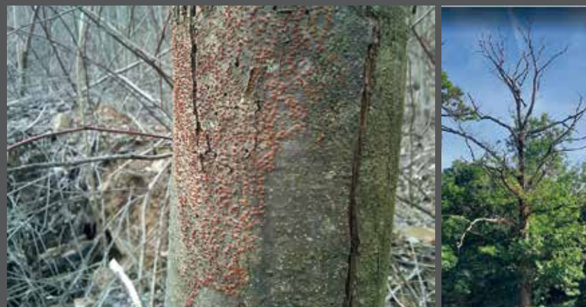
Ecorce attaquée par le chancre et châtaigner dépérissant

Le champignon entre dans l'arbre via des blessures sur l'écorce ; il provoque des nécroses qui peuvent encercler les branches et le tronc. Le champignon se dissémine par ses spores qui sont transportés par le vent, la pluie, les insectes, les oiseaux et les outils de coupe.