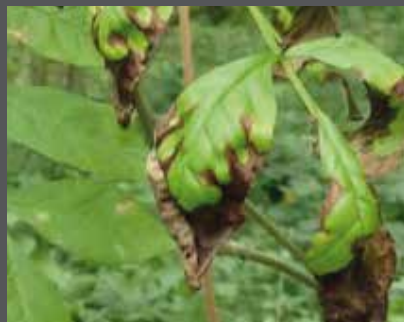
Feuilles de frêne avec les taches noires typiques du champignon

Le champignon produit des spores microscopiques transportées par le vent, parfois sur des dizaines de kilomètres, infectant de nouveaux arbres. L'infection débute par des taches noires sur les feuilles, puis migre vers les rameaux, les branches et finalement le tronc, compromettant la santé de l'arbre. Le bois contaminé, le matériel forestier non désinfecté et les sols infectés peuvent également propager la maladie.