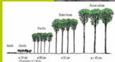
Futaie irrégulière, forêt plus ancienne et plus diversifiée