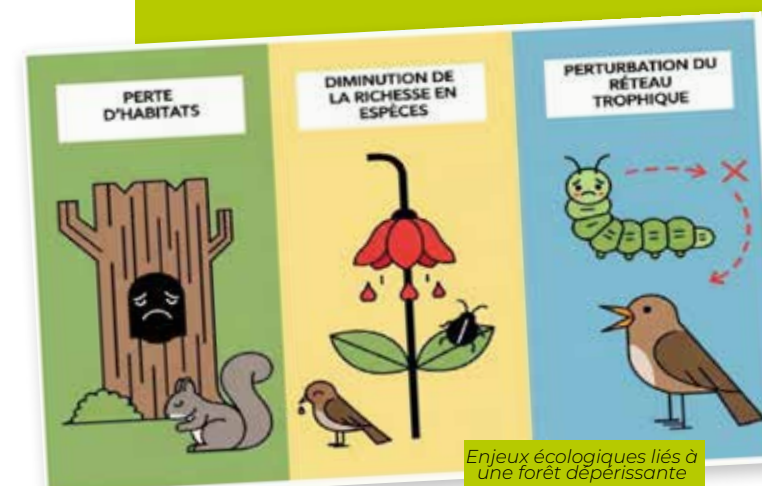
Enjeux écologiques liés à une forêt dépérissante