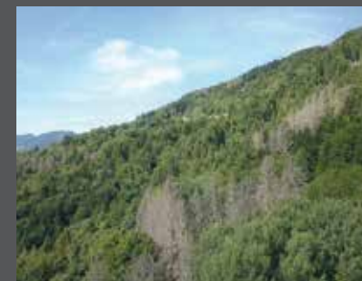
Parcelles d'épicéas ou pessières devenues brunes suite à une attaque par le scolyte

Les scolytes peuvent produire 2 ou 3 générations par an, voire 4 lorsque l'été est chaud. Les canicules sont donc un facteur aggravant, tout comme les sécheresses qui rendent l'arbre plus vulnérable aux attaques. D'autres facteurs environnementaux sont défavorables, comme les tempêtes qui produisent des arbres affaiblis ou des chablis (arbres au sol) que les scolytes affectent particulièrement.