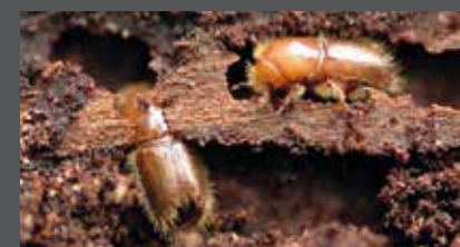
Scolytes adultes en action