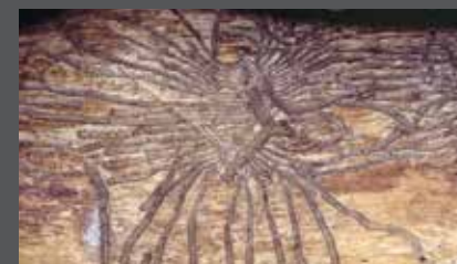
Galeries creusées par des larves de scolytes (réseau de galerie)