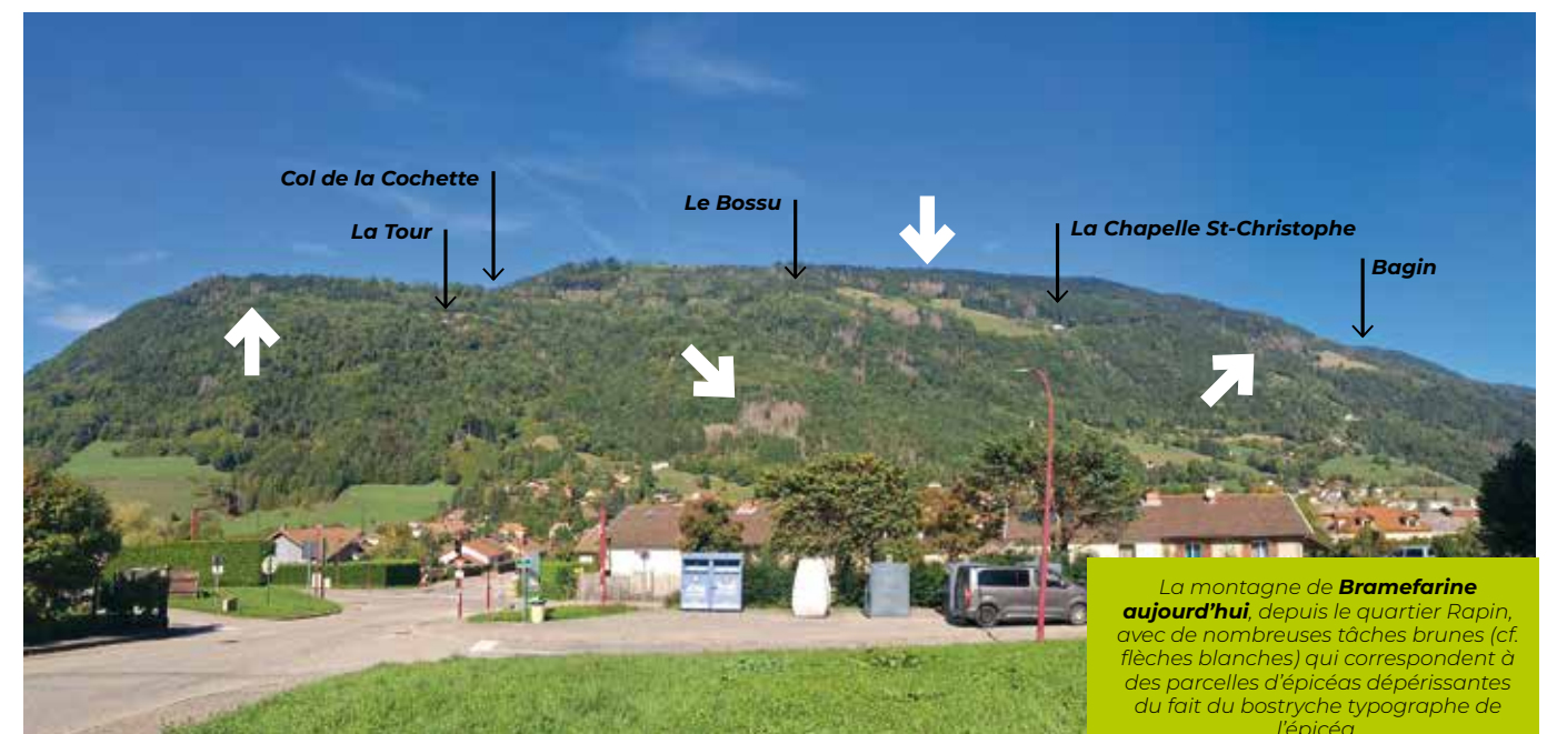
La montagne de Bramefarine aujourd'hui, depuis le quartier Rapin, avec de nombreuses tâches brunes (cf. flèches blanches) qui correspondent à des parcelles d'épicéas dépérissantes du fait du bostryche typographe de l'épicéa.

(photographie septembre 2025 / Frédéric Laval)