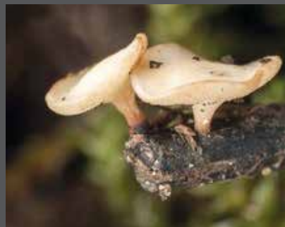
Champignons matures (quelques millimètres) et prêts à disperser leurs spores