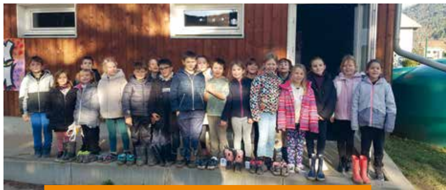
Equipe de plantation des tulipes: beau travail et bottes boueuses !