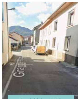
Etat initial en 2022

L'année 2025 a vu l'aboutissement des travaux de la grande rue. Les objectifs sont d'assurer une desserte piétonne sécurisée et adaptée aux personnes à mobilité réduite, de pacifier le trafic automobile et d'améliorer l'esthétique de la rue.