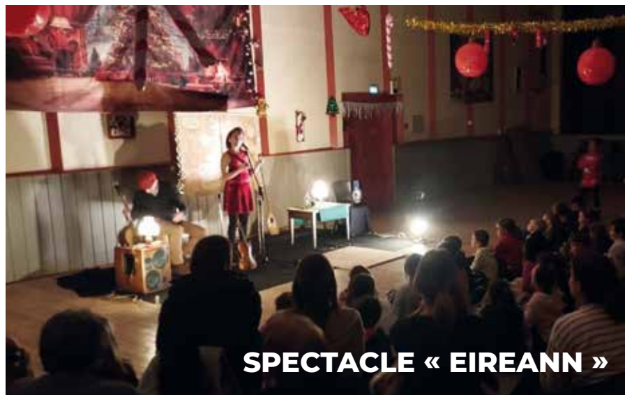
SPECTACLE « EIREANN »

Ce mercredi 10 décembre, à la salle des fêtes de Crêts en Belledonne le spectacle « Eireann » a fait voyager petits et grands.