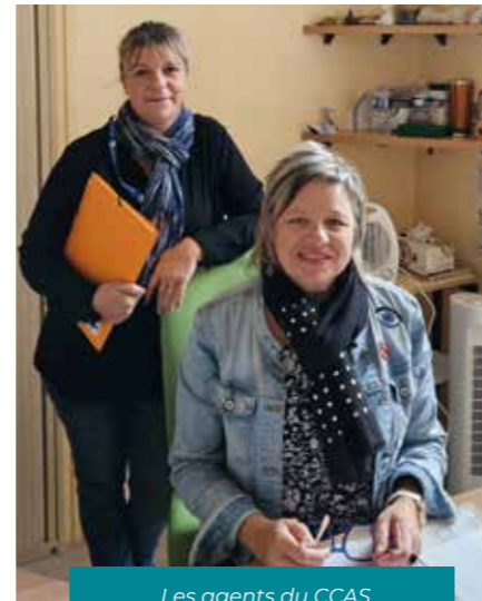
Les agents du CCAS

A l'écoute des besoins elles se rendent toujours disponibles pour que l'humain reste au cœur de leur mission.