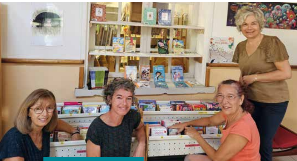
Les agents de la médiathèque