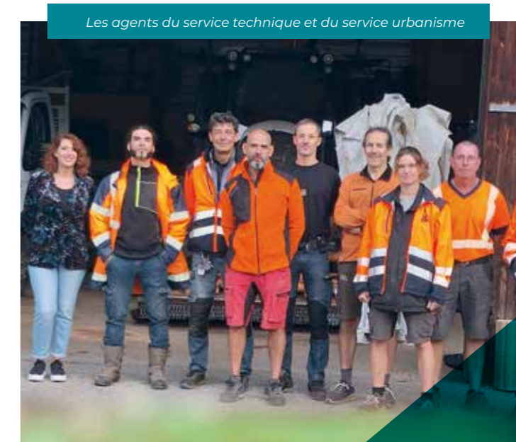
Les agents du service technique et du service urbanisme

Le service urbanisme joue ainsi un rôle crucial dans l'équilibre entre développement économique, préservation de l'environnement et qualité de vie des habitants. Il constitue un lien entre les élus, les citoyens et les différentes parties prenantes du territoire.