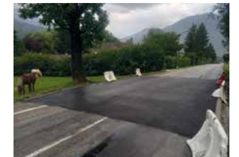
Le nouveau ralentisseur début sept 2024 avant les marquages au sol

Dans le courant de l'été, des chicanes provisoires ont été mises en test sur des lieux plus appropriés, et en septembre les aménagements définitifs ont été réalisés et combinés avec un ralentisseur (vitesse limitée à 30 km/h). Nous remercions les usagers de la route de bien réguler leur vitesse sur cette voirie dans le respect des riverains et des autres usagers.