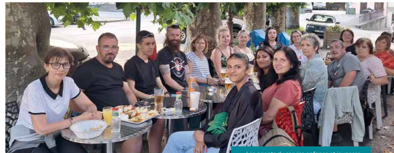
Les agents du service enfance et jeunesse

Les agents du service enfance et jeunesse sont très polyvalents et leur amplitude horaire au quotidien est étendue. Ils doivent parfois faire face à des troubles musculo squelettique, conséquence de gestes professionnels répétitifs.