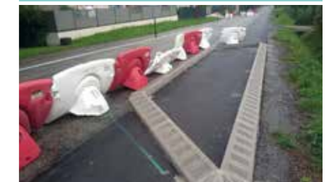
Chicane & zone de stationnement en cours de travaux en sept 2024 au droit du lotissement le long de la Route de Grenoble