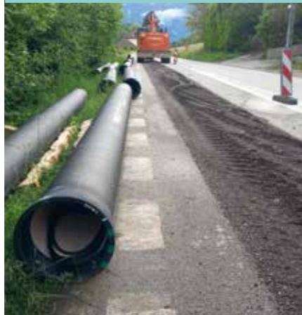
Le chantier a été mené par banalisation de la moitié de voirie de la RD525

Une journée portes ouvertes de découverte du chantier de gestion sédimentaire du bassin du Flumet a été organisée le 14 septembre 2024 par EDF et les entreprises chargées des travaux (groupement MIDALI-RAMPA-COLAS).