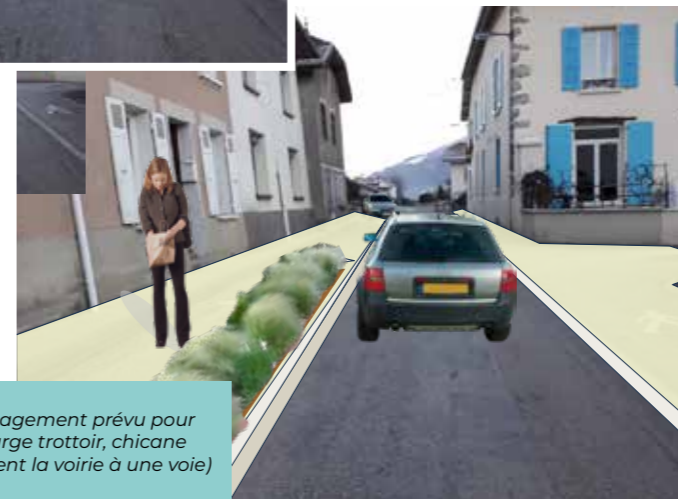
Exemple d'aménagement prévu pour la Grand Rue (large trottoir, chicane réduisant localement la voirie à une voie)