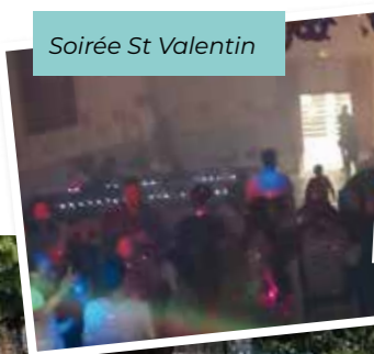
Soirée St Valentin