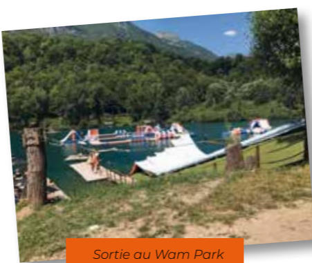
Sortie au Wam Park

Florent Facy, moniteur DE du club 06 08 09 96 46