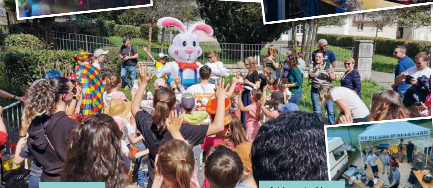
Chasse aux oeufs