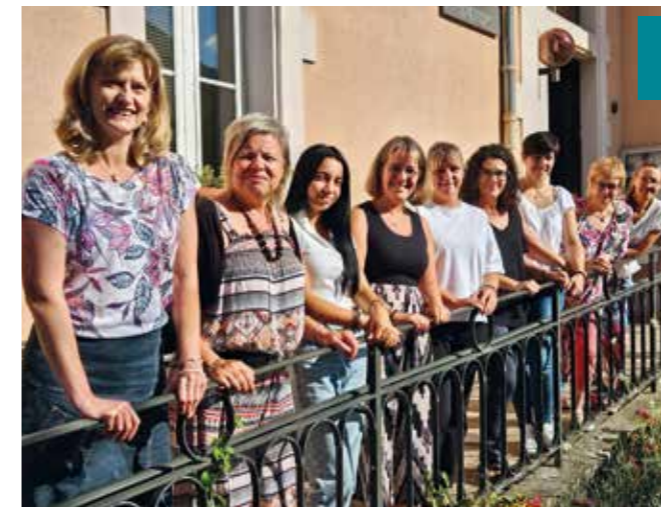
Les agents des services généraux

De par son rôle de médiateur, il vient à votre contact pour prévenir les incivilités, les conflits et pour améliorer votre cadre de vie.